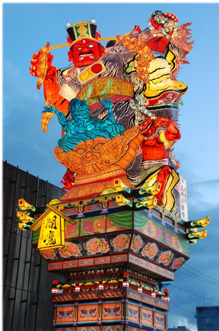
令和6年製作【閻魔（えんま）】

津軽の夏を彩る風物詩「ねぶた」は、明治中期から大正初期にかけて行われた当市の伝統文化であり、20メートル余の高さを誇る巨大なものでした。