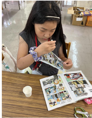
② 本の修理を行いました。