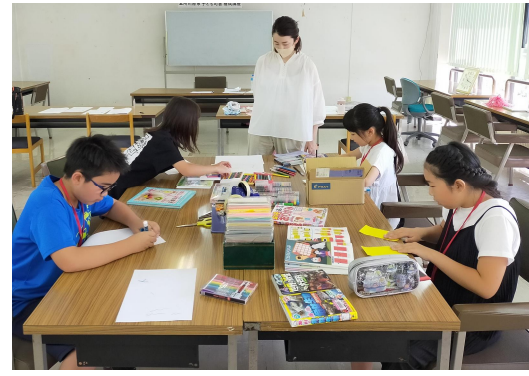
⑥ 展示の準備をしました。