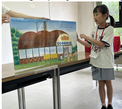
⑨ プレおはなし会の準備