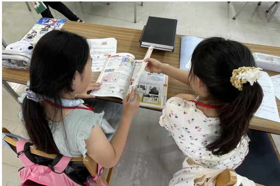
④ 分類について学びました。