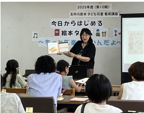
⑧ 読み聞かせについて学びました。