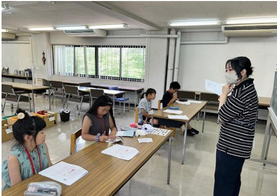
① 図書館について学びました。

2025年度(第10期)五所川原市子ども司書養成講座は、7月19日(土)~26日(土)までの7日間で行われました。4名が受講し、全員が「五所川原子ども司書」として認定されました。五所川原子ども司書は、合わせて94名となりました。